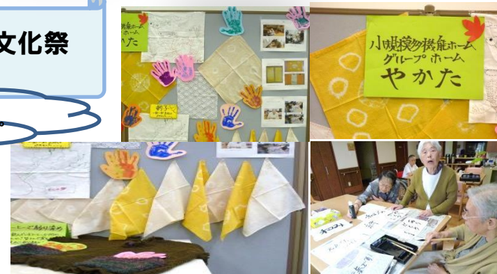
皆様の作品を沢山展示することができました。